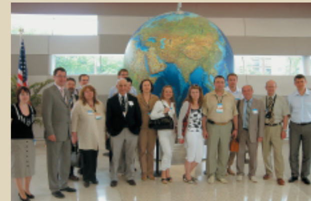
В учебно-технологическом центре ExxonMobil (Executive MBA: кадровая и социальная работа), США, 2008