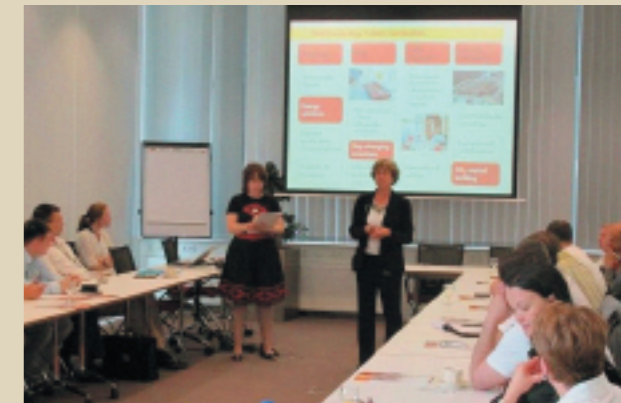
Семинар по инновационным технологиям, Нидерланды, Shell Technology Center, 2010