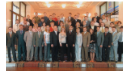
Выпуск группы «Нефтяной и газовый бизнес – 23» (ОАО «ЛУКОЙЛ»), Москва, июнь 2008