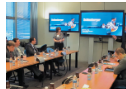
На семинаре в Schlumberger Riboud Product Center (Executive MBA - 04), Франция, 2010