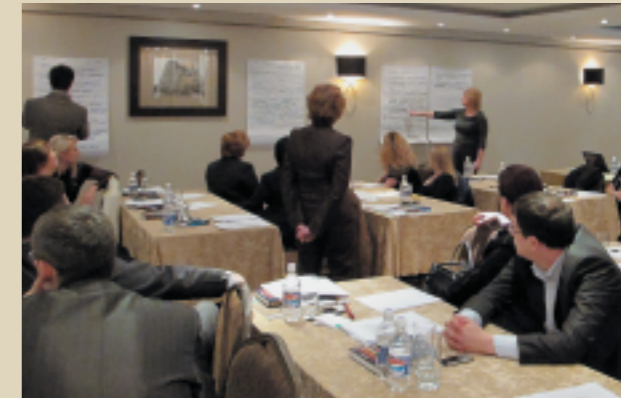
Модуль программы «Нефтяной и газовый бизнес: управление персоналом – 30», Баку, 2011

Начало программы – первое полугодие 2012 года.