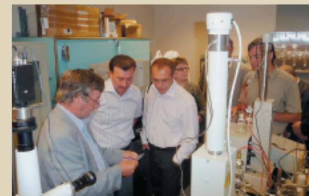
В лабораториях по изучению нефтеотдачи пластов, США, Стенфордский университет, 2009