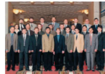
Выпуск группы «Нефтяной и газовый бизнес – 01» (ОАО «Татнефть»), Москва, февраль 2000

При необходимости слушатели программы могут разместиться в гостинице при Академии, которая соединена с учебными корпусами подземными переходами, что дает возможность, не выходя на улицу, посещать учебные занятия.