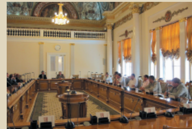
Лекция в Конституционном суде РФ, модуль Executive MBA в Санкт-Петербурге, 2010