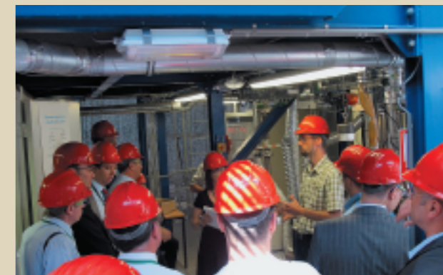
В лабораториях по изучению альтернативной энергетики, Нидерланды, Дельфтский технологический университет, 2010